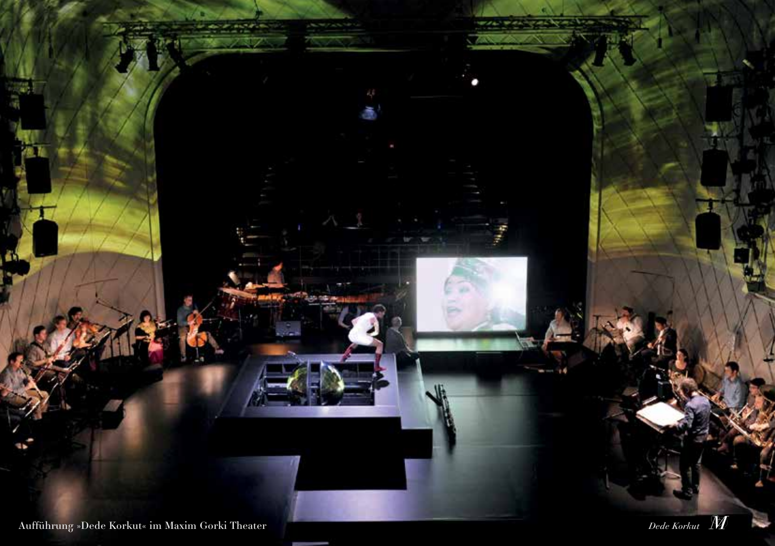
Aufführung »Dede Korkut« im Maxim Gorki Theater